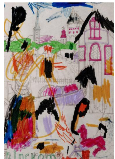
Kleurplaat van Nina, 4 jaar