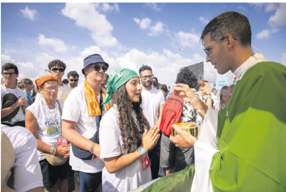
Jongeren ontvangen de Communie tijdens de grote slotmis op 3 augustus.

een groep uit het ene land een andere groep tegenkomt, wordt er geroepen, gelachen en maak je snel een praatje over waar je vandaan komt. Zo'n gezellig sfeertje heb ik nog nergens meegemaakt."