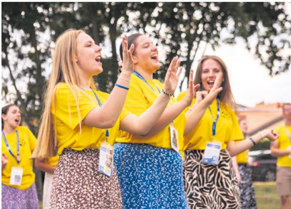
Vreugde tijdens de jubileumpelgrimage van de stichting die vele Poolse jongeren hielp aan een studiebeurs.

Een oproep van Johannes Paulus II tijdens zijn pausbezoek aan vaderland Polen leidde 25 jaar geleden tot de oprichting van een stichting die jongeren uit kansarme gezinnen een studiebeurs biedt, maar nog veel meer dan dat. “Dit is een gemeenschap voor het leven.”