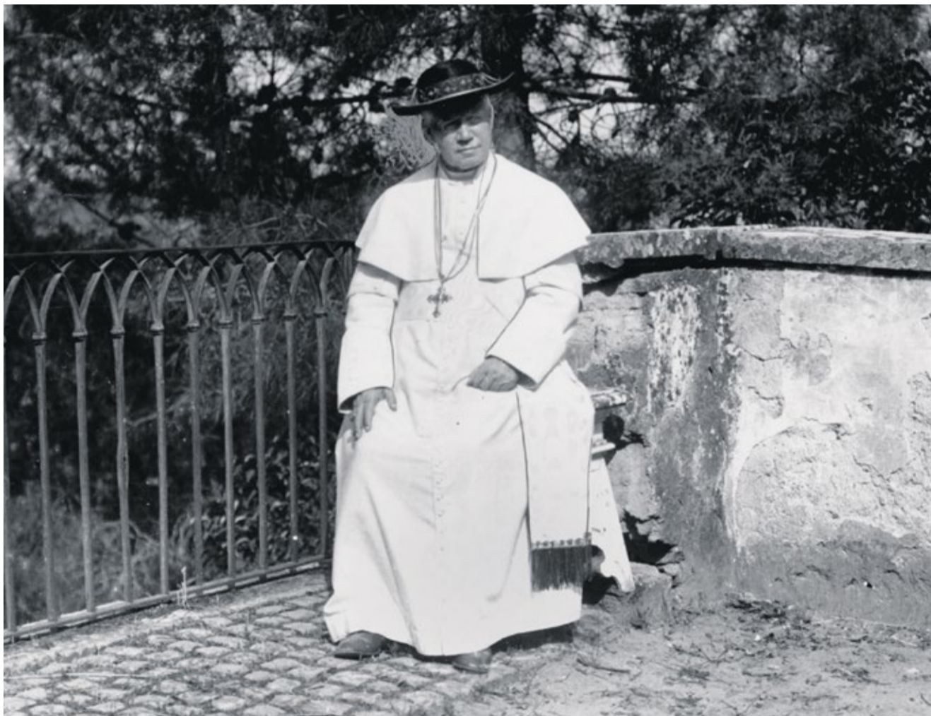
De heilige paus Pius X op een ongedateerde foto.

“Alles herstellen in Christus”: deze krachtige woorden uit de Brief aan de Efeziërs koos paus Pius X bij zijn aantreden in 1903 als motto. Toch zal deze paus waarschijnlijk niet zozeer herinnerd worden vanwege zijn herstel, als wel vanwege zijn verzet.