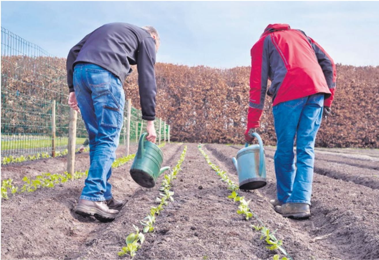
Twee bewoners aan het werk in de gedeelde moestuin.