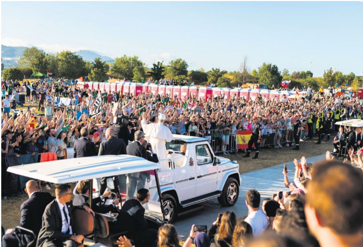
Van 28 juli tot 3 augustus kwamen een miljoen jongeren uit 146 landen – waaronder Nederland en België – naar Rome voor het Jubileum van de Jeugd.

Massa's jongeren waren onlangs in Rome voor het Jubileum van de Jeugd. Ontmoeting en je geloof een boost geven stonden een week lang centraal: "Iedereen juicht, zingt, spreekt elkaar aan... Ondanks de drukte heeft iedereen veel geduld met elkaar."