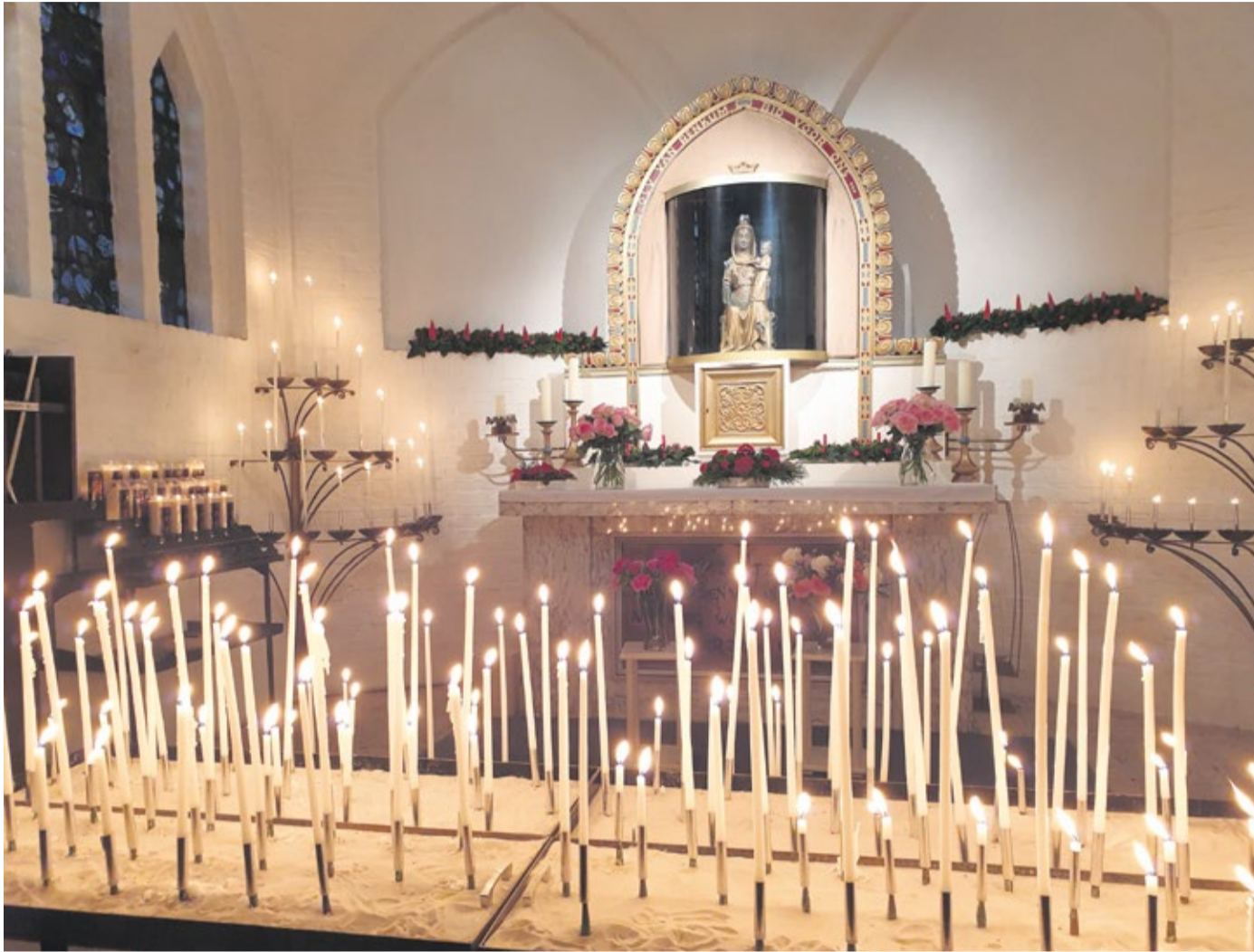
Het beeld van Maria van Renkum in de kerk van het dorp.