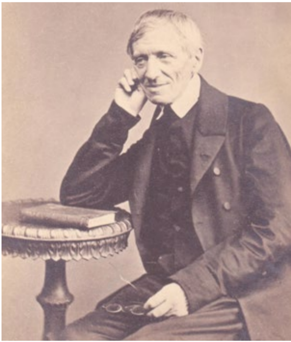
John Henry Newman op een ongedateerd portret.

Slechts 37 heiligen gingen hem voor. De Engelse kardinaal en theoloog John Henry Newman (1801–1890) wordt binnenkort uitgeroepen tot kerkleraar.