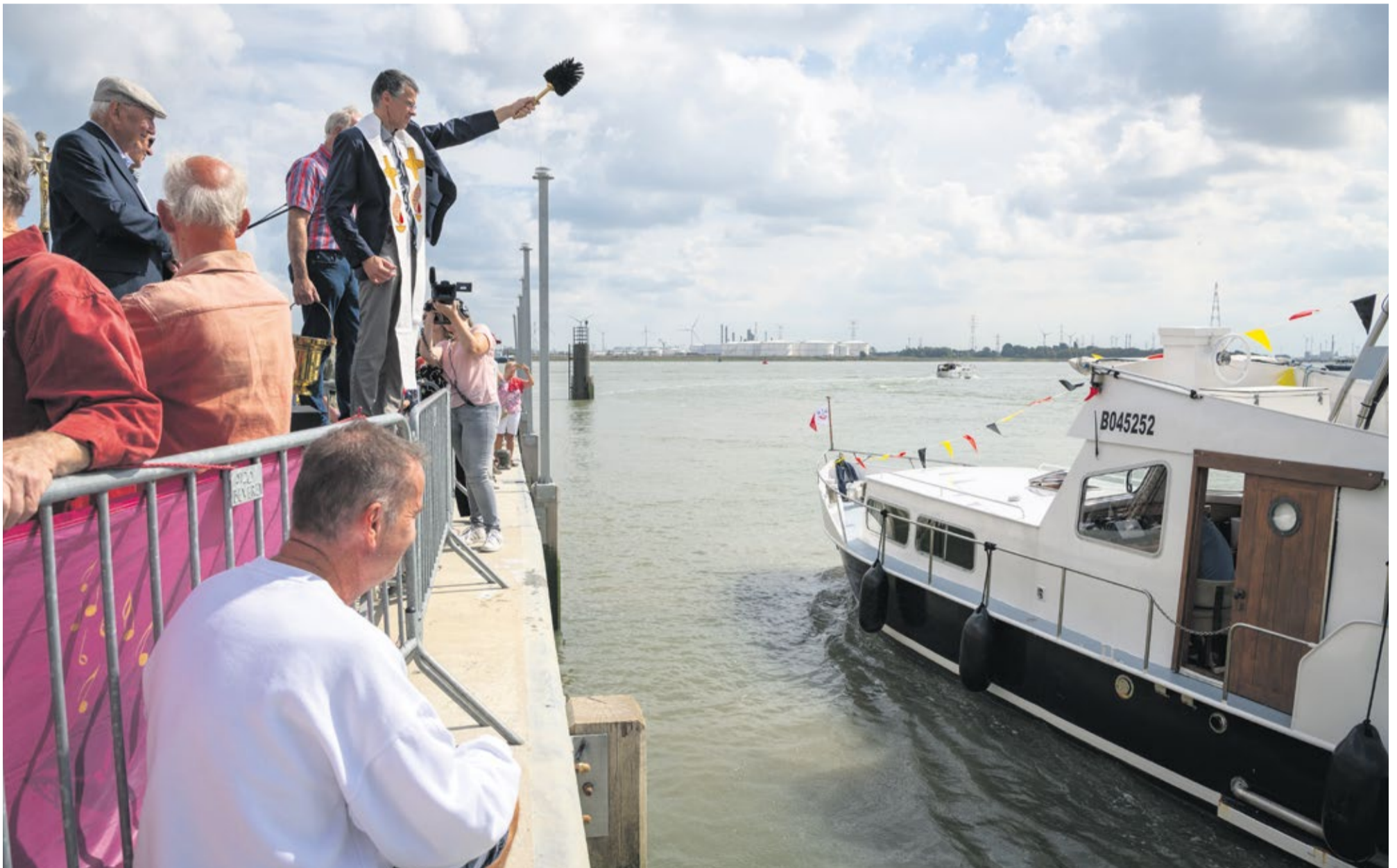
Elk jaar vindt in het Vlaamse dorp Doel de Scheldewijding plaats.

“Wij smeken U, zegen deze Scheldestroom, verkeersweg voor de schepen. En ook onze parochie, aan deze stroom ontstaan.” Dit gebed zal op 17 augustus tijdens de Scheldewijding in Doel opnieuw klinken. Voor de onwetende toehoorder zijn het mooie woorden, maar voor de Doelenaar zijn ze pure kracht voor de bevochten ziel van het dorp.