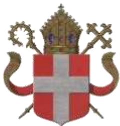
Op Tocht – Bisdom Utrecht (aandacht Red Wednesday)