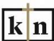
Katholiek Nieuwsblad Red Wedn.