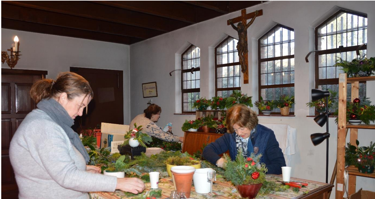
Vrijwilligers maakten 15 en 16 december kerststukjes voor de markt op 17 december.