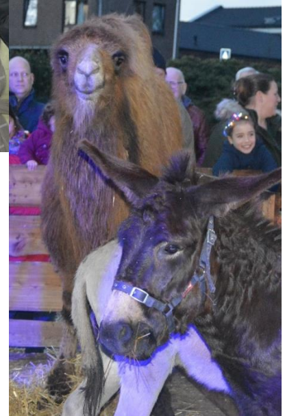
Foto: de herders, engelen en levende dieren

Het spel van "De Levende Kerststal" was een succes. Veel publiek, eerst op het kerkplein en later in de kerk. Een uitgebreide fotoreportage is in een afzonderlijk pdf-bestand op onze website te bekijken.