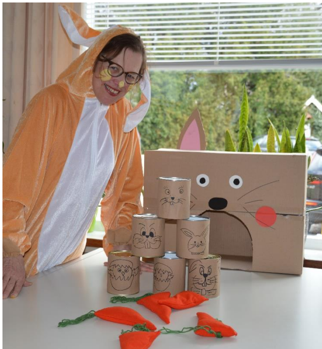
Stoffen wortels gooien