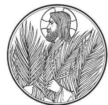
Denkend aan Hem