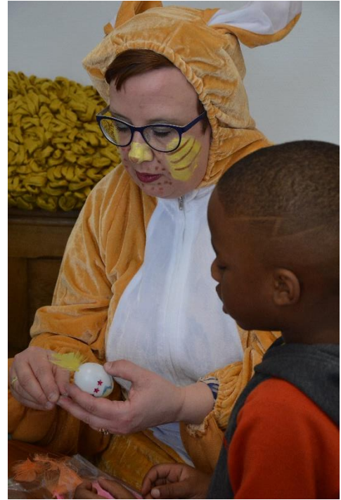
Met aandacht werken