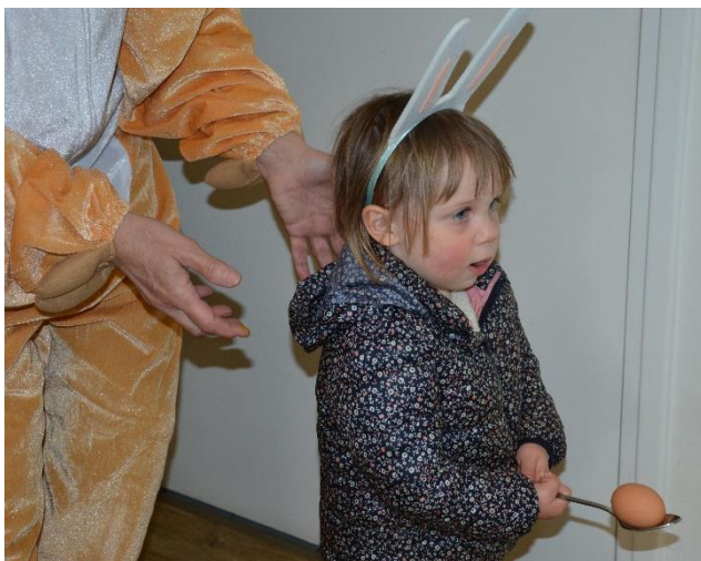
Ei op lepel valt niet mee