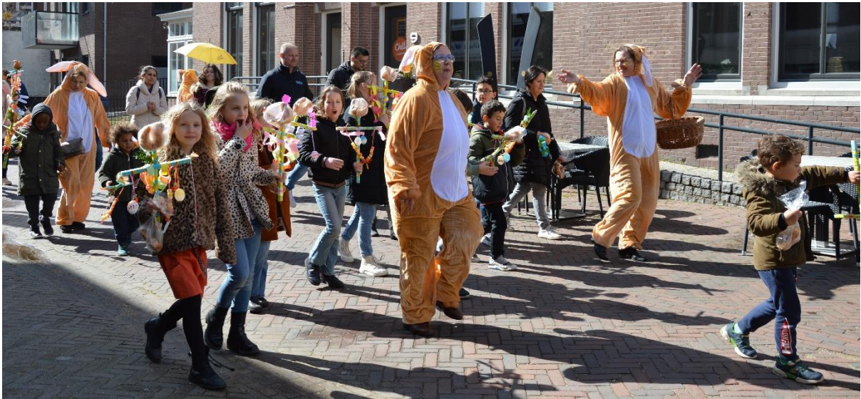
Terug richting de kerk, het begin en eindpunt van de optocht.