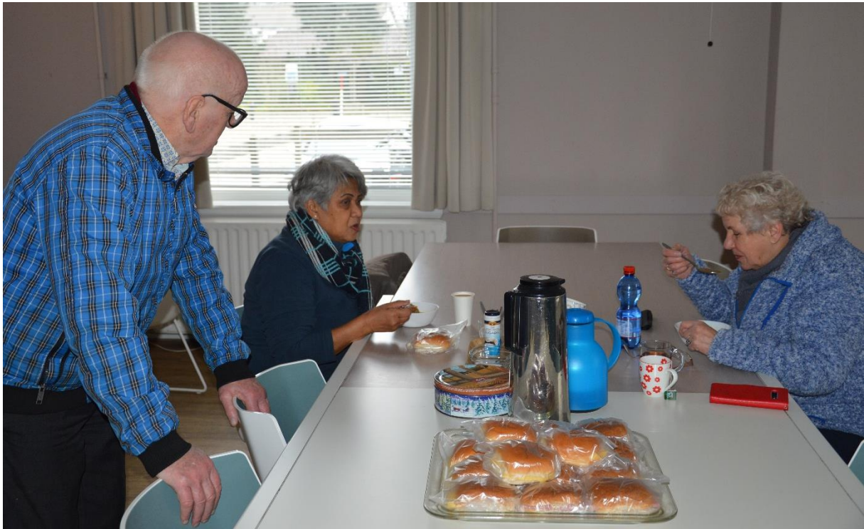
Even elkaar afwisselen..... broodje kaas, soep en koffie.....