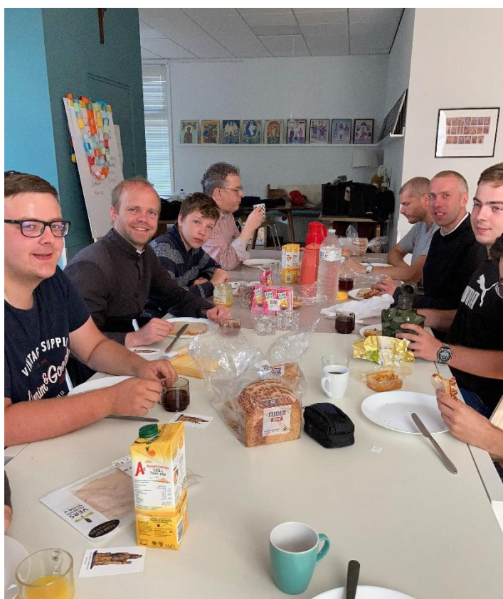
Slapen en ontbijten in de pastorie