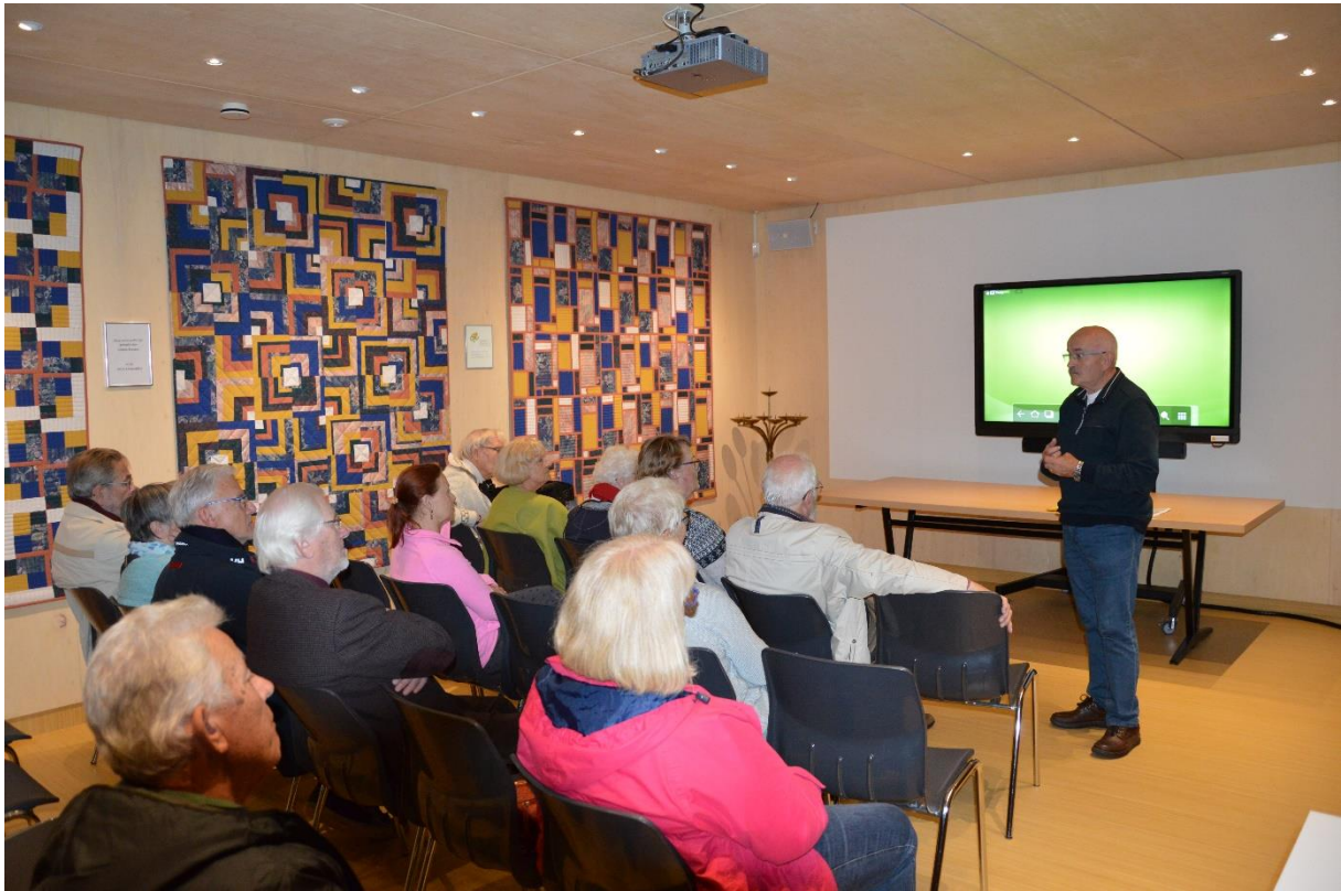
Een presentatie, uitleg met een video over de geschiedenis van de kerk.